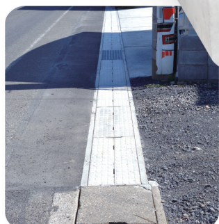
館林土木発注工事